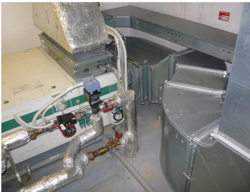
Stávající stav – pohled do prostoru za VZT jednotkou. / Stávající periferie MaR a čerpadlo na větvi teplé vody.